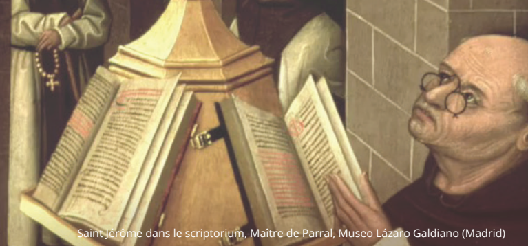
Saint Jérôme dans le scriptorium, Maître de Parral, Museo Lázaro Galdiano (Madrid)